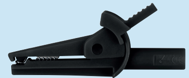
SAK 6716 / 4 / ..(Farbe) SAK 6716 / 4 / ..(colour)