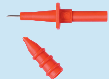
SPS 2590 /..(Farbe) SPS 2590 /..(colour)