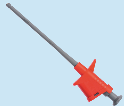
KPS 6755 /..(Farbe) KPS 6755 /..(colour)