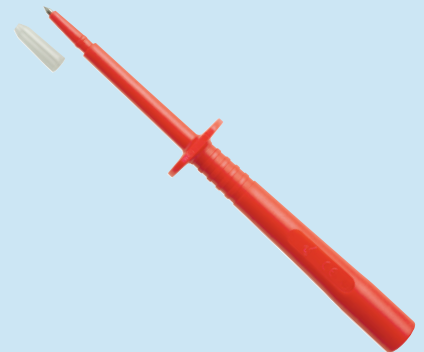
SPS 6890 Ni /..(Farbe) SPS 6890 Ni /..(colour)