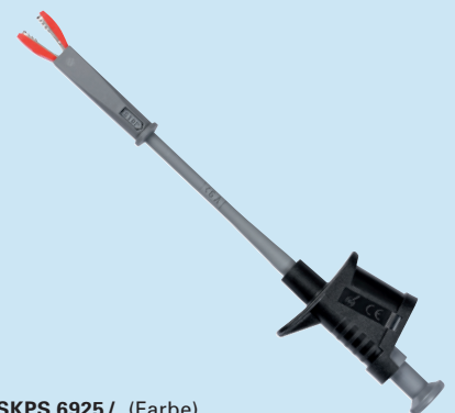
SKPS 6925 /..(Farbe) SKPS 6925 /..(colour)