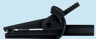
SAK 6716 / 4 / ..(Farbe) SAK 6716 / 4 / ..(colour)