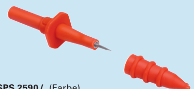
SPS 2590 / ..(Farbe) SPS 2590 / ..(colour)