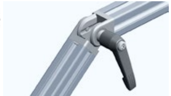
Gelenk 20 mit Klemmhebel Pivot Joint 20 with Locking Lever