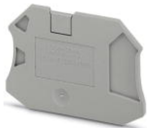
Концевая крышка, длина: 56,8 мм, ширина: 2,2 мм, высота: 39,8 мм, цвет: серый

Обратите внимание на то, что приведенные здесь данные взяты из online-каталога. Полная информация и данные содержатся в документации пользователя. Действуют Общие условия использования для информации, загруженной из интернета. ( http://phoenixcontact.ru/download )