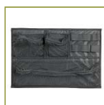
Организер в крышку