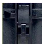
Надежный запирающий механизм