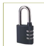
Навесной кодовый замок