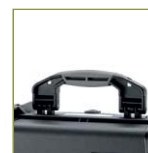
Ручка с мягким покрытием