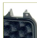
Уплотнительное кольцо в крышку