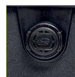
Автоматический клапан выравнивания давления