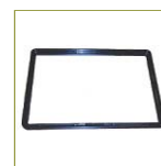
Держатель приборной панели в корпусе