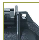
Отверстие для навесного замка