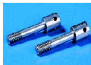
Deckelschrauben plombierbar, Best.-Nr. siehe Seite 106.