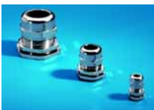
Kabelverschraubung Messing, Best.-Nr. siehe Seite 972.