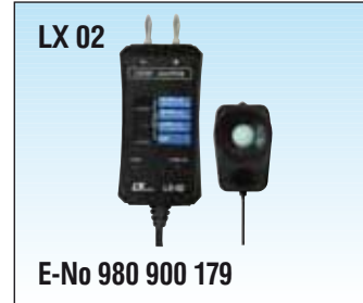
E-No 980 900 179