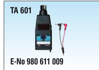
E-No 980 611 009