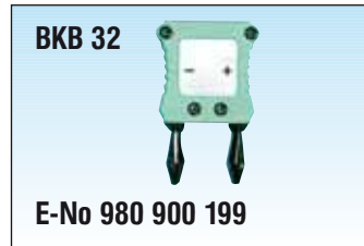
E-No 980 900 199

Adaptateur pour des sondes de température type K