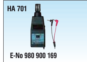
E-No 980 900 169