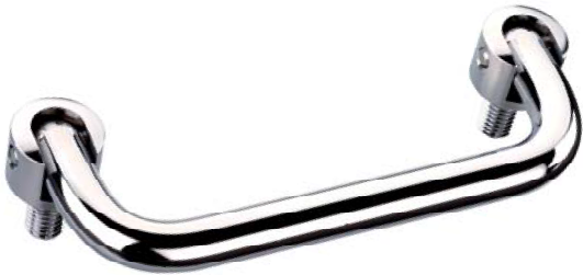
Ausführung verchromt Chromium plated version

Collapsible handle in three design types for the use on measuring devices. In both end positions, the handle is locked with a spring.