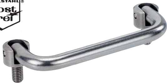
Ausführung in rostfreiem Edelstahl, Oberfläche matt glänzend Stainless Steel, surface shiny matt