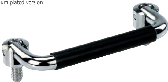
Ausführung verchromt mit Kunststoffüberzug Chromium plated with plastic coating version