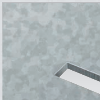
90 55 280: вырубание краев и выламывание в одном рабочем ходе