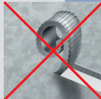
Вырубание без стружки