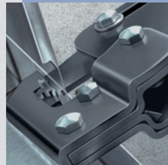
Пуансон инструмента продавливается через профили