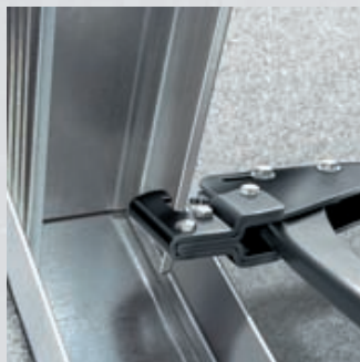
Установка инструмента на оба соединяемых профиля