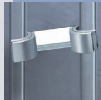
Готовое соединение листовых профилей