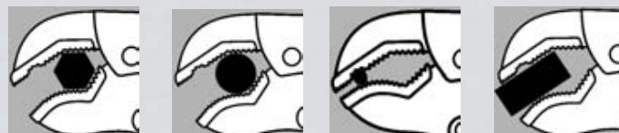
Примеры использования 41 14 250

Форма 1: Губки с двойной выборкой для фиксации круглых, профилированных и плоских деталей