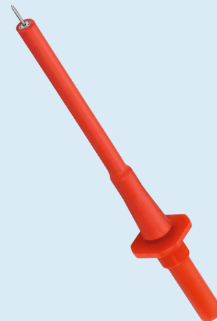
SPS 7097 Ni/..(Farbe) SPS 7097 Ni/..(colour)