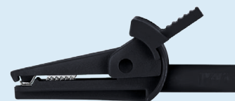
SAK 6715 Ni/2/..(Farbe) SAK 6715 Ni/2/..(colour)