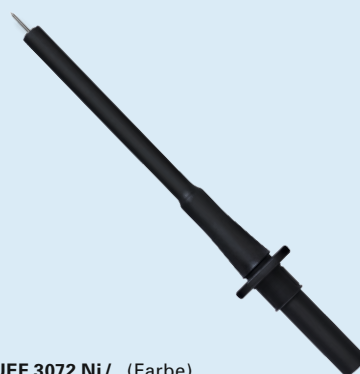
PRUEF 3072 Ni / ..(Farbe) PRUEF 3072 Ni / ..(colour)