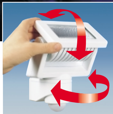
HS 150/300/500, vertikal +110° bis -40° und horizontal ±40° schwenkbar