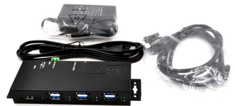
EX-K1110 - DC-Jack ~ Terminal Block