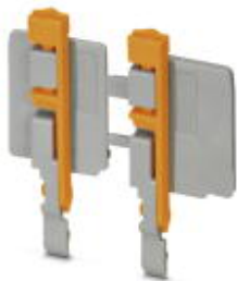
Flanschdeckel, Länge: 35,8 mm, Breite: 4,5 mm, Höhe: 24,7 mm, Farbe: grau

Bitte beachten Sie, dass die hier angegebenen Daten dem Online-Katalog entnommen sind. Die vollständigen Informationen und Daten entnehmen Sie bitte der Anwenderdokumentation. Es gelten die Allgemeinen Nutzungsbedingungen für Internet-Downloads. ( http://phoenixcontact.de/download )