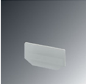
Abschlussdeckel, Länge: 68 mm, Breite: 2,2 mm, Höhe: 34 mm, Farbe: grau

Bitte beachten Sie, dass die hier angegebenen Daten dem Online-Katalog entnommen sind. Die vollständigen Informationen und Daten entnehmen Sie bitte der Anwenderdokumentation. Es gelten die Allgemeinen Nutzungsbedingungen für Internet-Downloads. ( http://phoenixcontact.de/download )